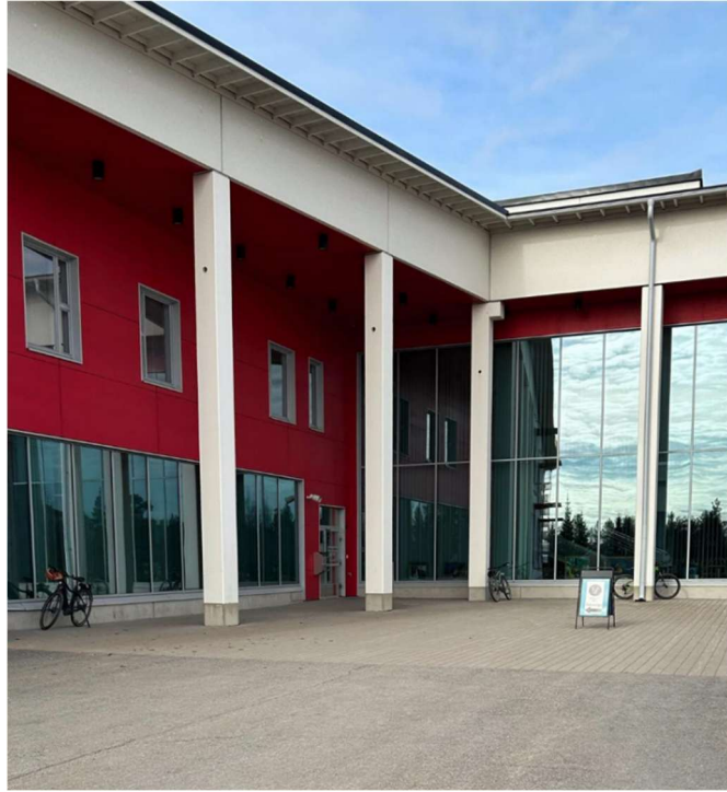
Kuva 1: Monitoimikeskus Silta, joka toimi alue- ja kuntavaalien 2025 ennakköäänestyspaikkana ja varsinaisen äänestyspäivän äänestyspaikkana.